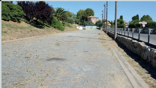
Boulodrome Ouvert à tous toute l'année Route de Cuxac d'Aude