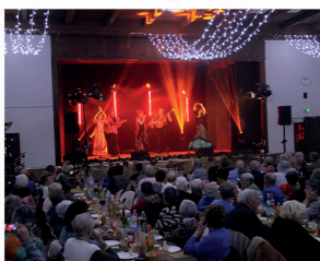
Goûter des aînés