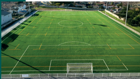
Stade municipal Saint-Exupéry Pelouse synthétique Av. du Stade