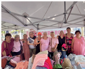
Atelier tricot solidaire