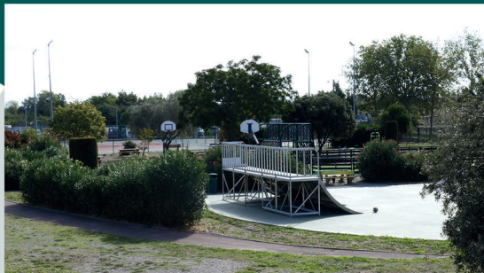
Jardin du Roy Aire de jeux, terrains multisport, skatepark, tables de pique-nique...