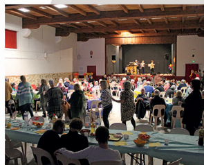
Fête des grands-mères