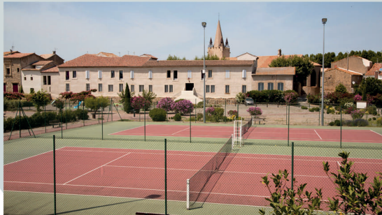
Terrains de tennis Jardin du Roy